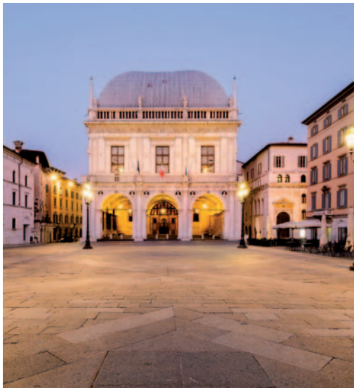
Vista su Brescia